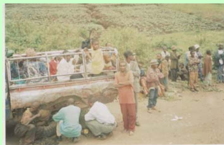
La camionnette surchargée des Pygmées à connu moult panne au cours du voyage

Le lendemain 23 octobre 2004, 69 pygmées se sont ainsi entassés dans une camionnette Toyota Hilux pour descendre au chef-lieu de la province du Sud-Kivu. Une femme pygmée avait pris place à bord de ce véhicule avec son enfant de 4 mois. Ne pouvant pas téter pendant le voyage et étouffant dans la cargaison humaine, le bébé arriva à Bukavu dans un état fort inquiétant.